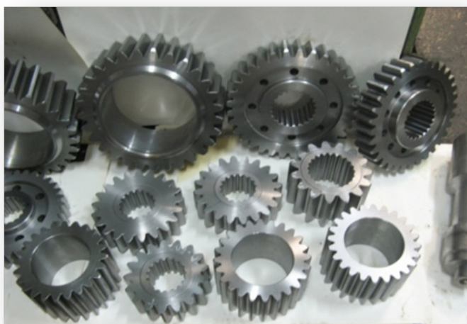
Зубчатые колеса очистного комбайна

Разработка и изготовление специальных редукторов.